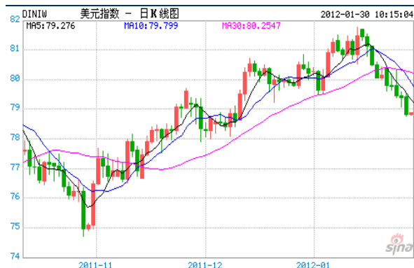
图2：美元指数近期走势图